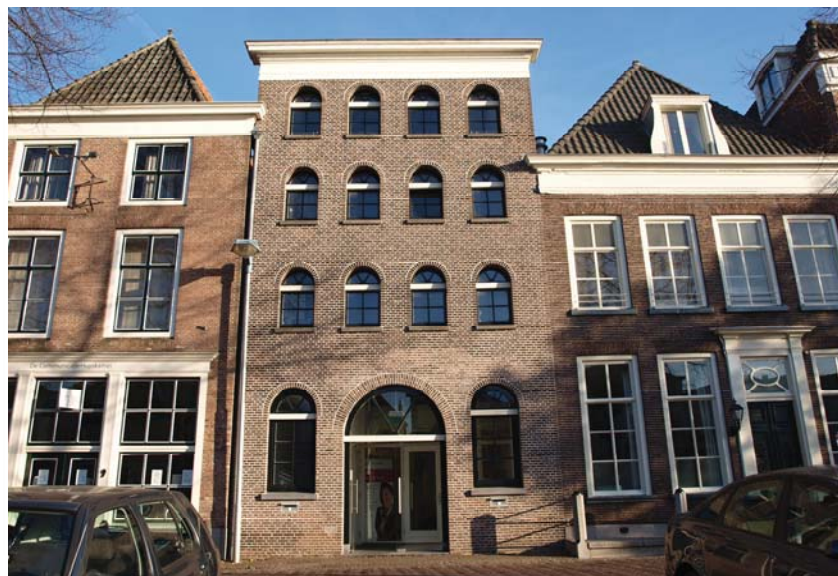
KANTOORRUIMTE in historisch pakhuis